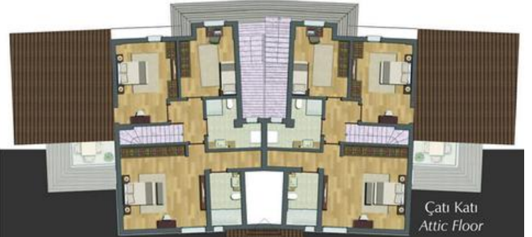
Çatı Katı Planı Attic Duplex Plan

Net Alan Net Area 103,70 m 2 Balkon Dahil Balcony Included Net Area 118,35 m 2 Brüt Alan Gross Area 126 m 2