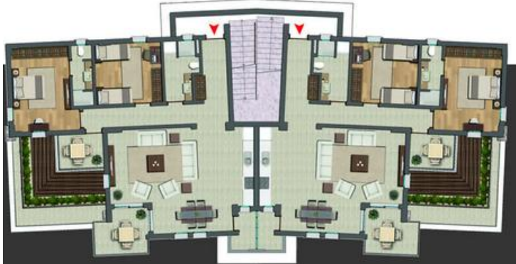
Birinci Kat Planı First Floor Plan

Giriş + Hol : 16,70 m 2 Entrance + Corridor Salon + Mutfak : 45,20 m 2 Dining Room with Kitchen Ortak Banyo : 6,60 m 2 Common Bathroom Yatak Odası : 13,15 m 2 Bedroom Ebeveyn Yatak Odası : 17,60 m 2 Master Bedroom Ebeveyn Banyo : 4,45 m 2 Master Bathroom - WC