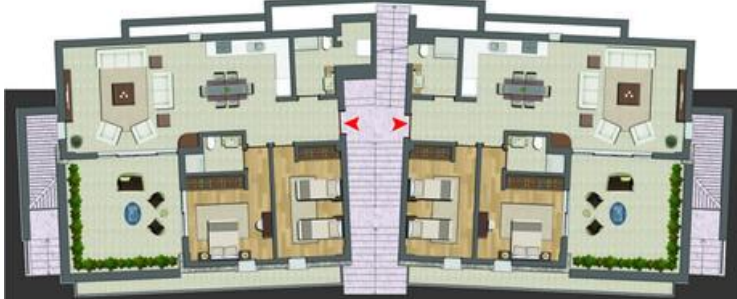
Zemin Kat Planı Ground Floor Plan

Salon + Mutfak : 51,40 m 2 Dining Room with Kitchen Ortak Banyo : 10,00 m 2 Common Bathroom Yatak Odası : 17,15 m 2 Bedroom Ebeveyn Yatak Odası : 17,80 m 2 Master Bedroom Ebeveyn Banyo : 4,00 m 2 Master Bathroom - WC