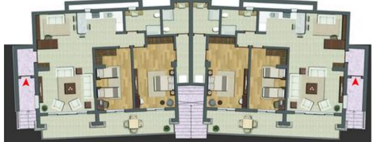
Bahçe Katı Planı Basement Floor Plan

Giriş+Salon+Mutfak+Hol : 66,50 m 2 Entrance+Dining Room with Kitchen+Corridor Ortak Banyo : 7,10 m 2 Common Bathroom Yatak Odası : 18,10 m 2 Bedroom Ebeveyn Yatak Odası : 22,50 m 2 Master Bedroom Ebeveyn Banyo : 7,15 m 2 Master Bathroom Depo Alanı : 5,70 m 2 Storage